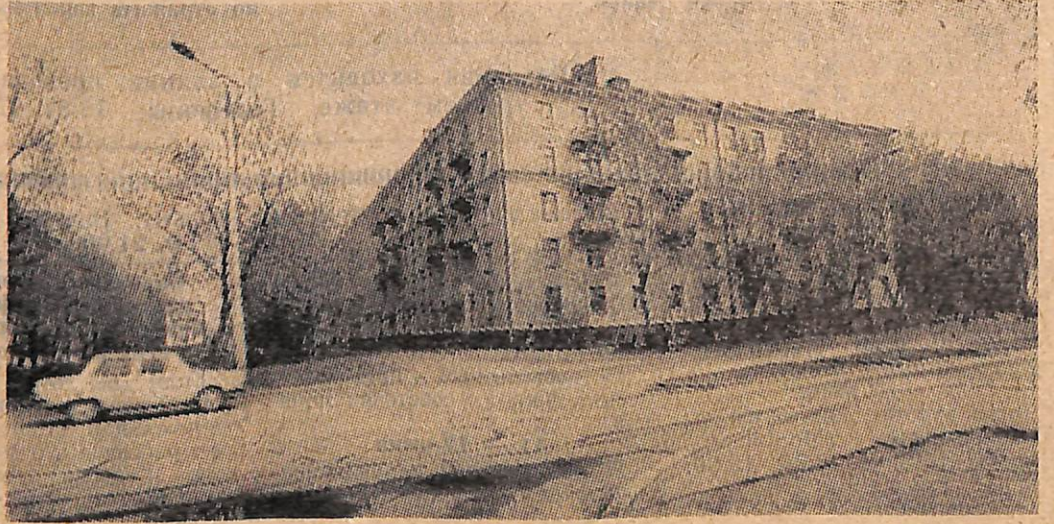
Улица Центральная. Слева — так она начиналась; справа — день сегодняшний.