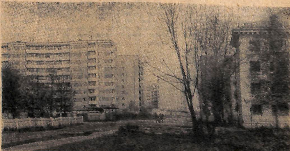
Улица Свободы 30 лет назад и сейчас.