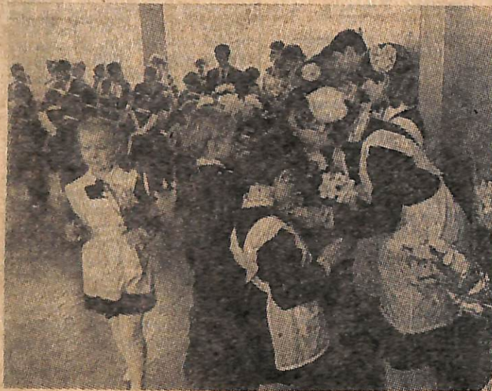
На днях для выпускников школ города прозвенел последний звонок.